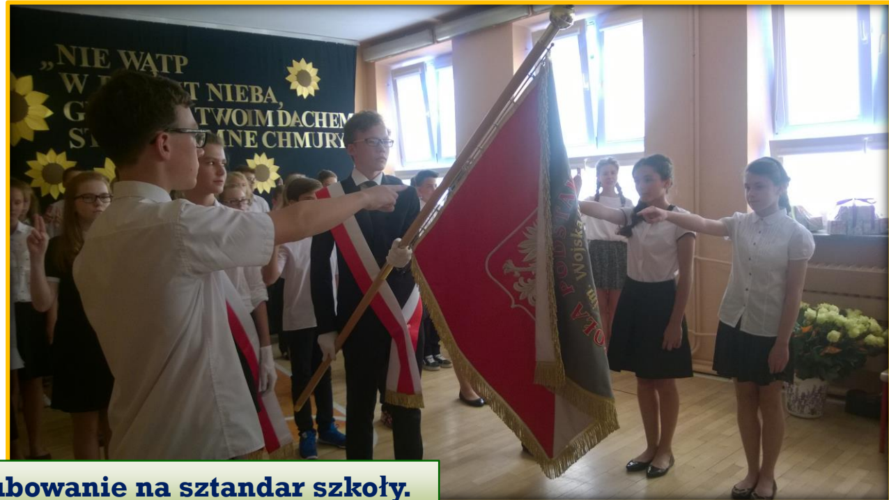
Ślubowanie na sztandar szkoły.