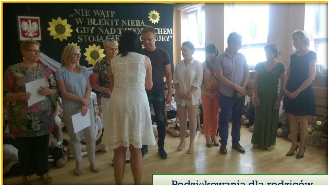
Podziękowania dla rodziców.