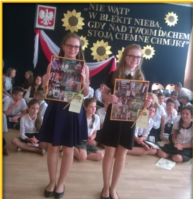
Nagrody, nagrody, nagrody